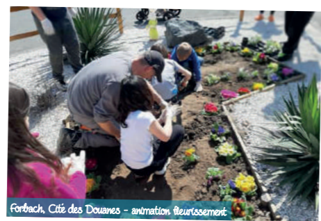
Forbach, Cité des Douanes - animation fleurissement