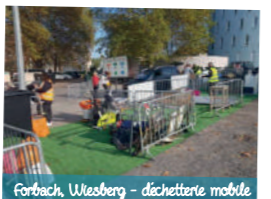
Forbach, Wiesberg - déchetterie mobile