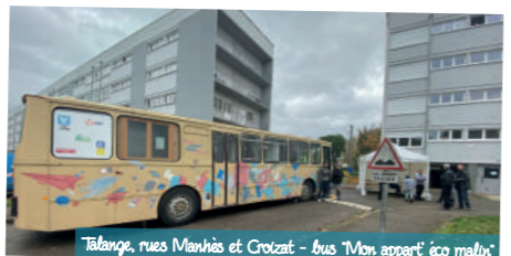
Talange, rues Manhès et Croizat - bus "Mon appart' éco malin"