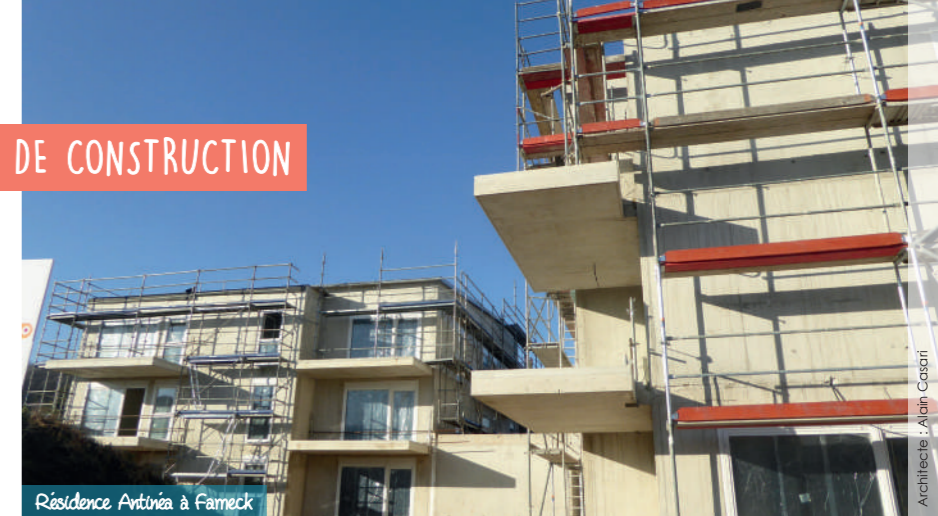
Résidence Antinea à Fameck