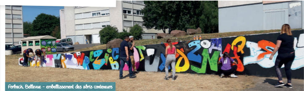
Forbach, Bellevue - embellissement des abris conteneurs