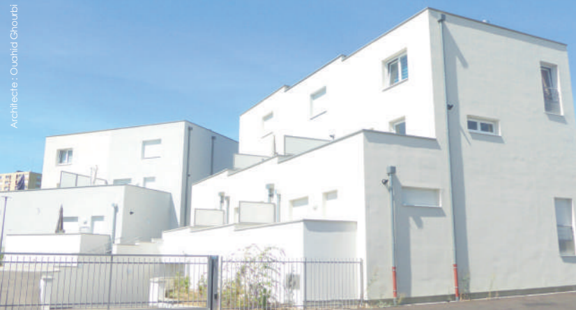
Le Clos des Sarments à Thionville