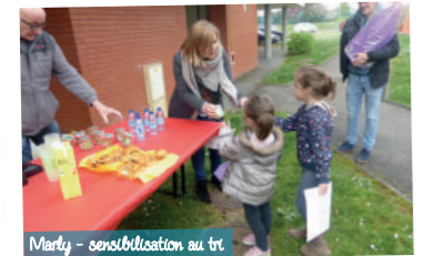
Marly - sensibilisation au tri