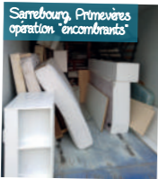
Sarrebourg, Primevères opération "encombrants"