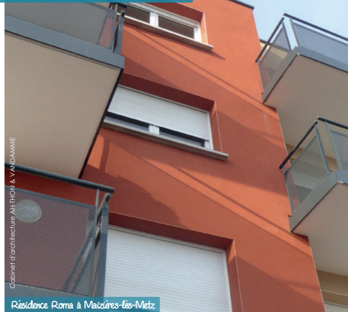
Résidence Roma à Maizières-les-Metz

Cabinet d'architecture AHTHON & VANDAMME