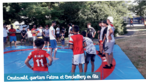
Creutzwald, quartiers Fatima et Breckelberg en fête